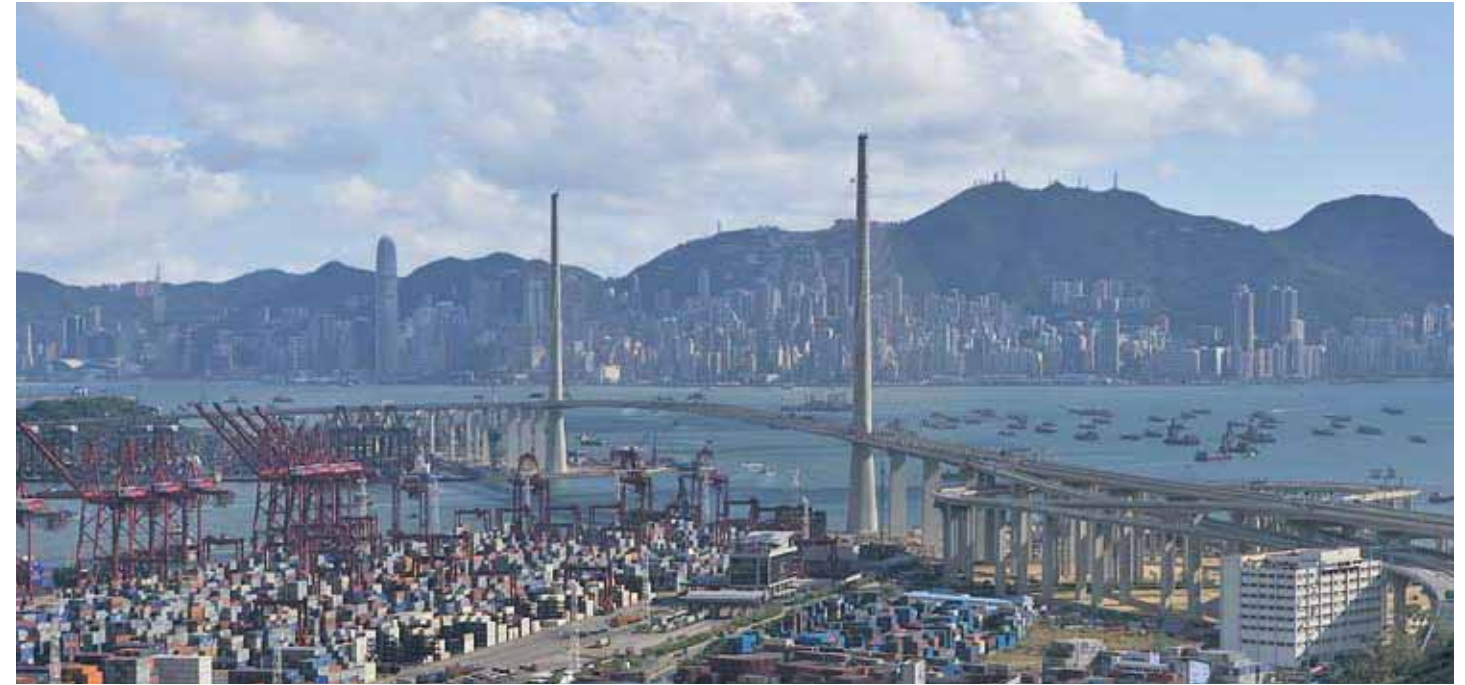
香港・昂船洲大橋 Stonecutters Bridge in Hong Kong