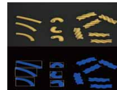
パスタの形状検査例 Example of shape inspection of pasta