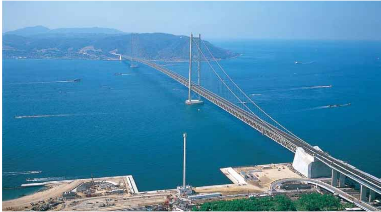
明石海峡大橋 Akashi-Kaikyo Bridge