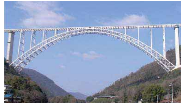
広島空港大橋 Hiroshima Airport Bridge