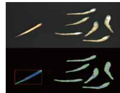
カエリチリメンからの異物摘出例 Example of removing foreign-substances from Kaerichirimen (type of dried young sardines)