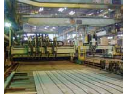
縦リブ組立装置 Longitudinal Ribs Assembling Machine