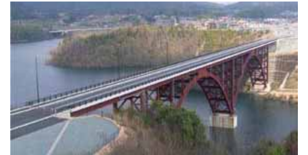
しゃくなげ大橋 Shakunage Bridge