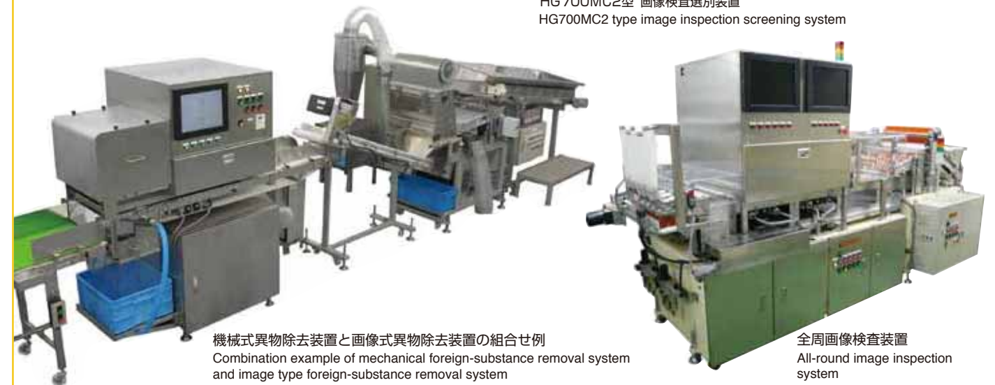
機械式異物除去装置と画像式異物除去装置の組合せ例 Combination example of mechanical foreign-substance removal system and image type foreign-substance removal system