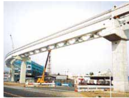
多摩モノレール Tama Monorail