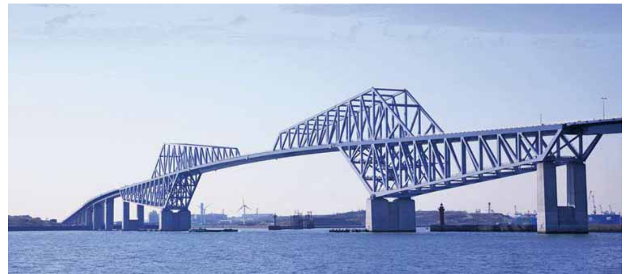
東京ゲートブリッジ Tokyo Gate Bridge