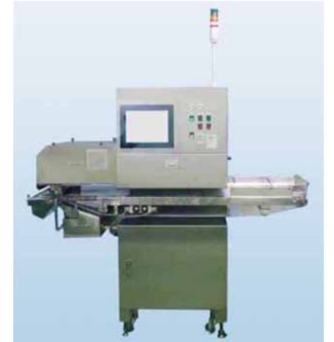
HG700MC2型 画像検査選別装置 HG700MC2 type image inspection screening system

In the Mukaishima Food Machinery Department, we manufacture and sell foreign-substance removal systems and screening systems in order to remove foreign-substances or defects that were mixed in the raw material in the production / processing process of fishery products (dried young sardines, seaweed, hijiki algae, etc), powder, snacks, etc. In the sample test room, there are various devices installed so we can deal with various raw materials. We implement the treatment test of the raw materials that our customers provide and we propose a suitable system for our customers.