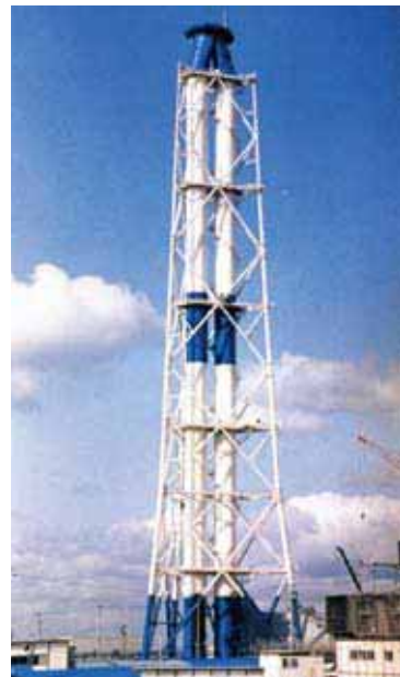
鋼製煙突 Steel Stack