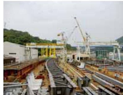
仮組立ヤード Trial Assembly Yard