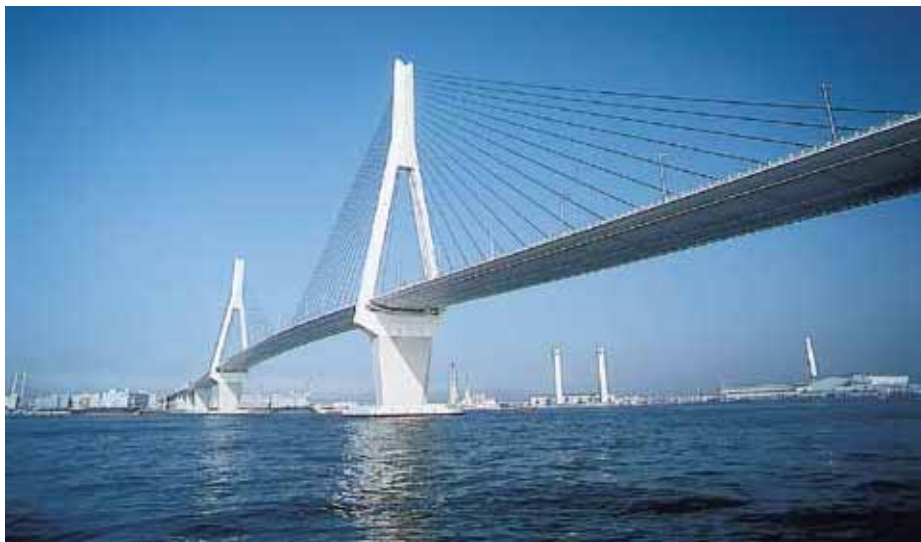
鶴見つばさ橋 Tsurumi Tsubasa Bridge