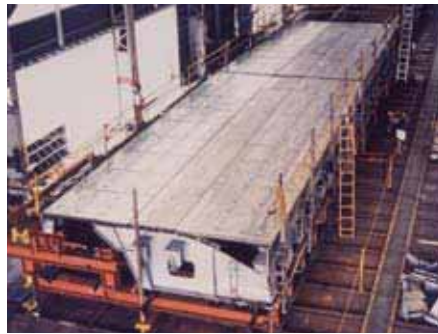
ローリングリーフ式伸縮装置 Rolling-Leaf Type Road Expansion Joint Device