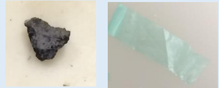
石や砂、ビニール片