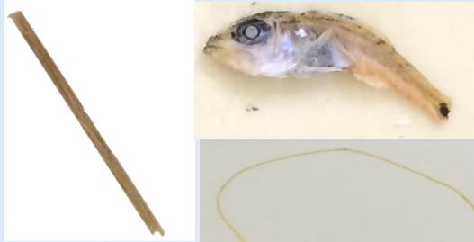
粉、木片、異魚種、テグス