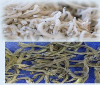
煮干(ちりめんじゃこ、かえり)